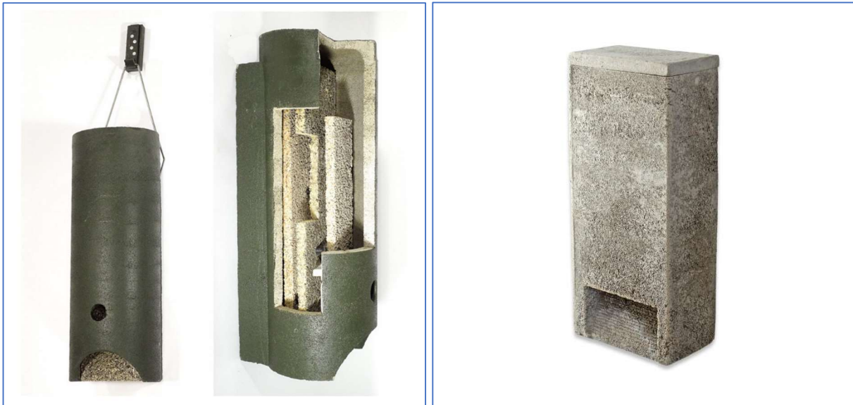
Abb. 12 und 13 Fledermaus-Großraumhöhle zur Montage an Bäumen oder einem Mast und Fledermaus-Fassadenkasten zur Integration in ein Gebäude.