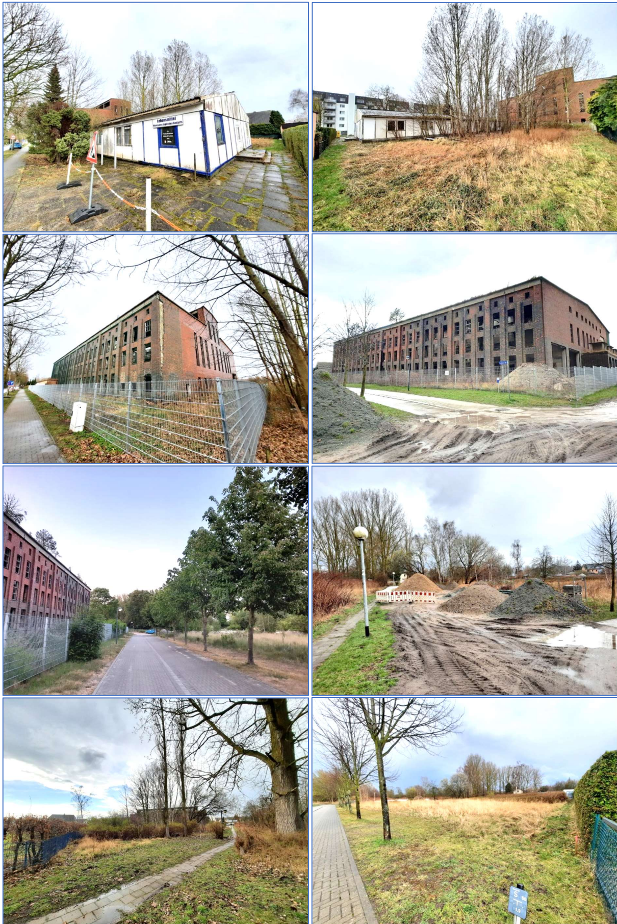
Abb. 3 bis 10 Ansichten des Plan-/Untersuchungsgebietes.