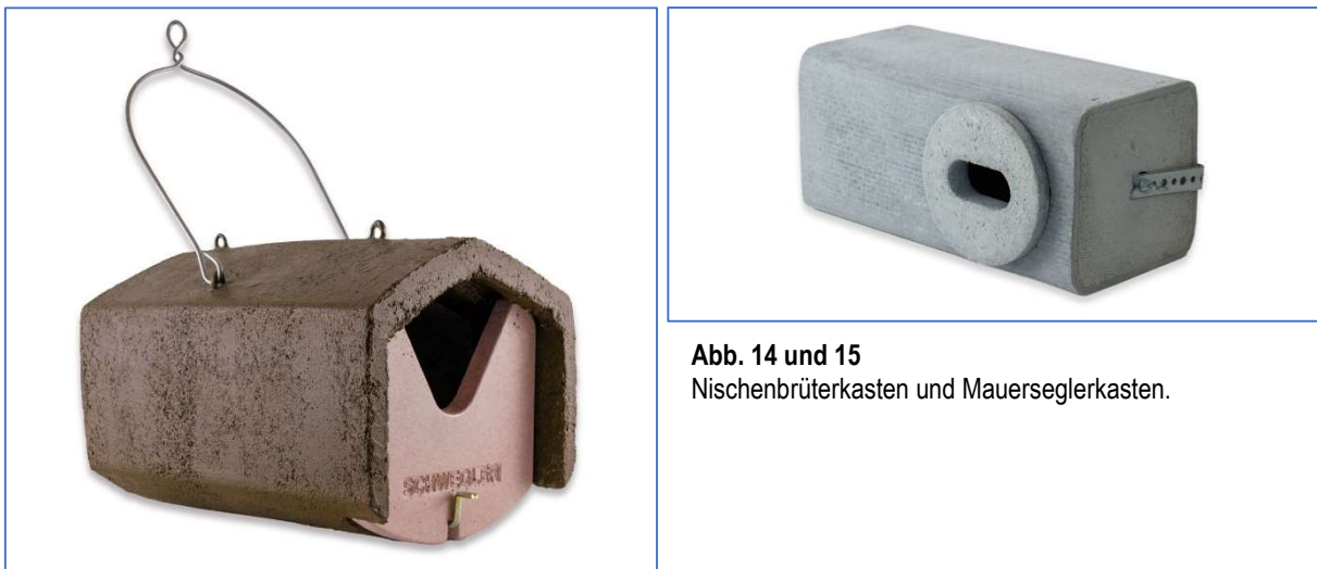
Abb. 14 und 15 Nischenbrüterkasten und Mauerseglerkasten.