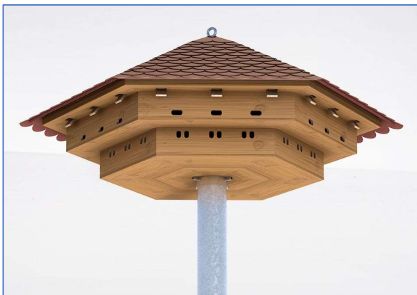
Abb. 11 Beispiel eines Mauerseglerurms mit Brutplätzen für Haussperlinge

Dauerhafte Ersatzlebensstätten werden in Abstimmung mit einem Sachverständigen und dem Denkmalschutz am Sauerstoffwerk angelegt. Alternativ ist auch eine Anlage an oder in den geplanten Neubauten möglich. Es werden mind. vier Fassadenkästen montiert oder integriert.