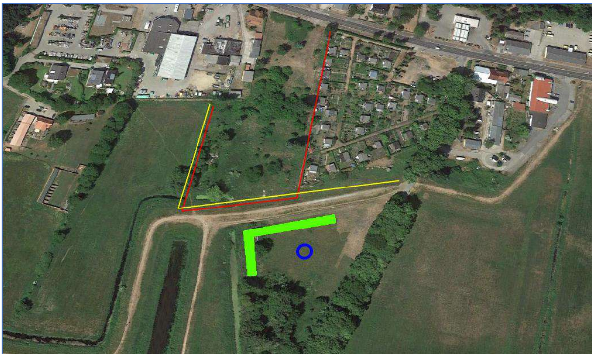
Abb. 5 Amphibienschutzzaun ab März bis Ende April (rot) Amphibienschutzzaun ab Mai bis Bauende (gelb) Kleingewässer (blau) Hecke/ Gebüschfläche mit Steinschüttung/ Trockenmauer (grün)

In unmittelbarer Nähe zum Vorhabengebiet (Grünlandfläche südlich des Plangebietes) wird die Hecke/ Gebüschfläche durch ein Überwinterungsquartier ergänzt. Dazu wird eine Gesteinsaufschüttung/ Trockenmauer (Länge 8 m, Breite 2 m und Höhe 1 m, Gründung nach Aushub auf 30 cm Schotterbett, aus kantigen oder gebrochenen Natursteinen, versetzt mit 10% Totholzästen) errichtet.