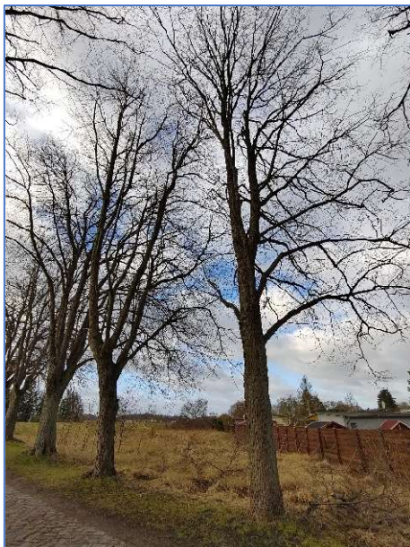
Abb. 3 Bäume im Bereich der geplanten Zufahrt

Eine erneute Begehung der Vorhabenfläche erfolgte am 23.02.2022. Der Gehölzbestand wurde auf das Vorkommen geschützter Tierarten bzw. auf Vorkommen von geschützten Lebensstätten untersucht (Brutplätze, Fledermausquartiere, Lebensstätten von xylobionten Käfern etc.). An Hand der Biotopausstattung und der Ortslage wurde des Weiteren das mögliche Vorkommen und das Gefährdungspotential geschützter oder gefährdeter Tier- und Pflanzenarten beurteilt (artenschutzrechtliche Potenzialabschätzung). Zudem wurden weitere Bestandsdaten recherchiert, z. B. Umweltkartenportals des Landes M-V und Verbreitungsatlas der Amphibien und Reptilien Deutschlands.