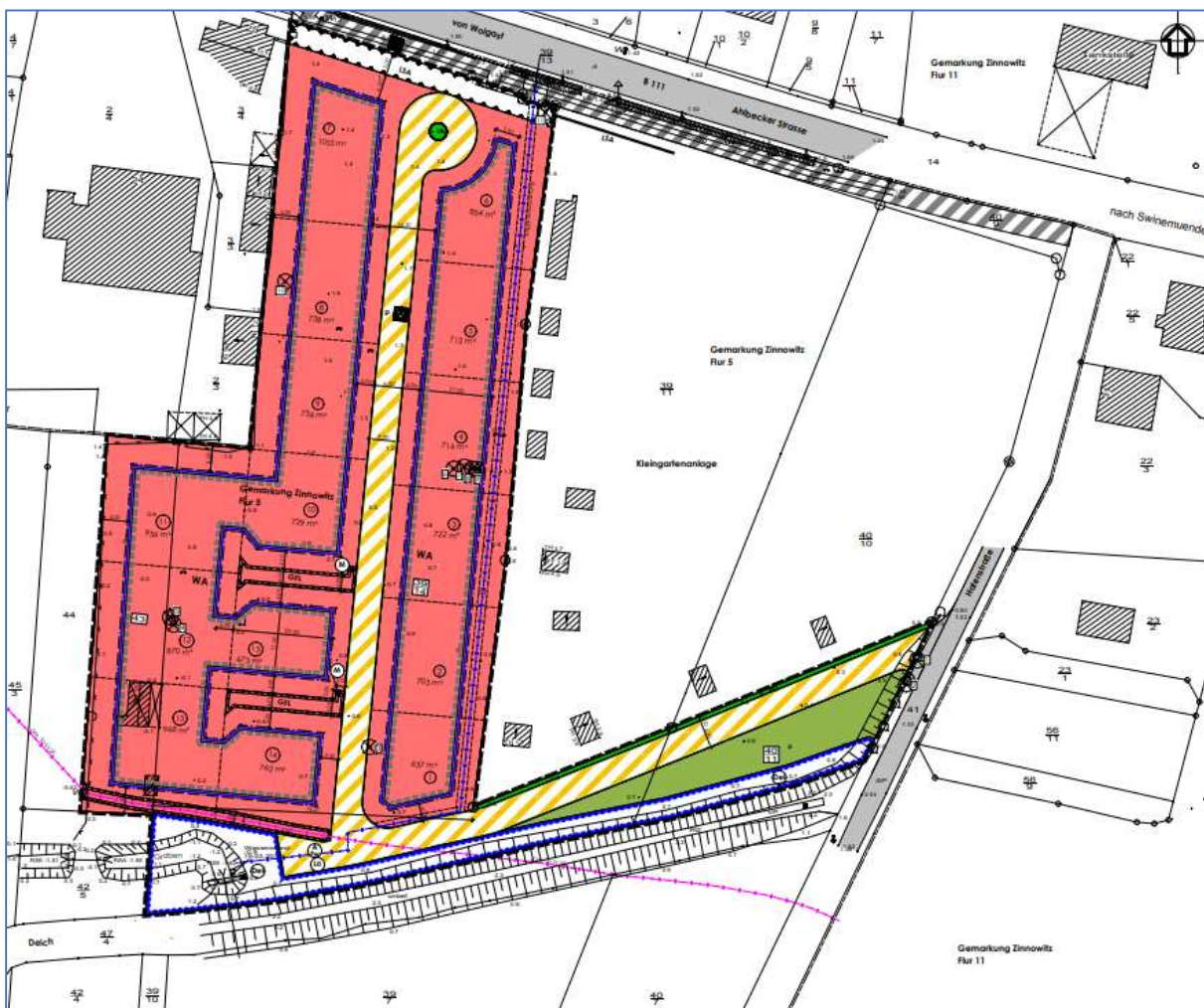
Abb. 1 Auszug Planzeichnung Bauungsplan Nr. 36 „Wohngebiet an der Hafenstraße“ nördlich des Natursegelhafens Stöhr-Laacke der Gemeinde Ostseebad Zinnowitz

Bebauungsplan Nr. 36 „Wohngebiet an der Hafenstraße“ der Gemeinde Ostseebad Zinnowitz