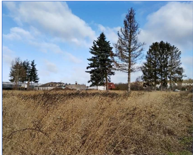
Abb. 4 Ansicht der Vorhabenfläche