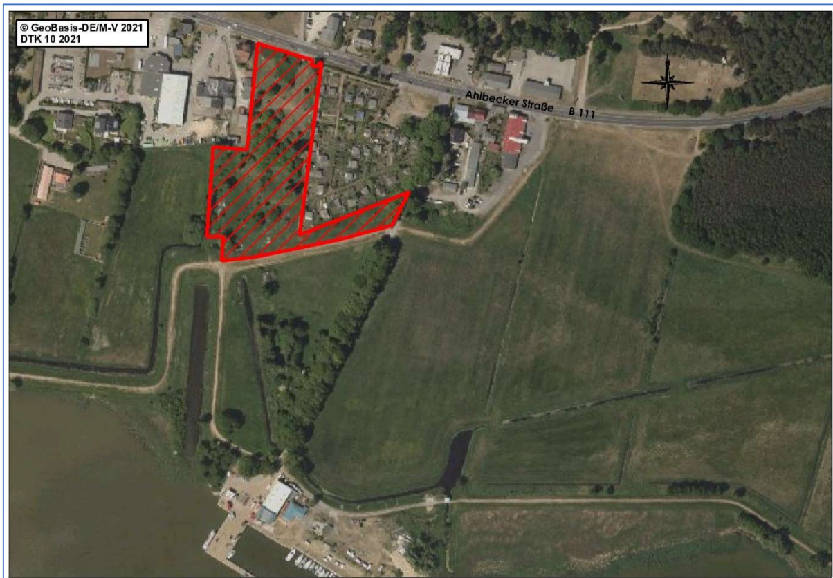
Abb. 2 Luftbild - Lage des Bauvorhabens in der Gemeinde Ostseebad Zinnowitz

Durch die geplante Rodung von Gehölzen und durch Biotopveränderungen können geschützte Tierarten erheblich gestört oder getötet werden bzw. können deren Lebensstätten zerstört werden. Betroffen sein können v. a. Vogel- und Fledermausarten, ggf. auch Insekten (Stechimmen und xylobionte Käferarten). Zudem ist eine Betroffenheit von Amphibien- und Reptilienvorkommen möglich. In der Nähe sind zudem Vorkommen von Biber und Fischotter bekannt. Eine Gefährdung anderer Tiergruppen oder geschützter Pflanzenarten kann an Hand der Biotopausstattung ausgeschlossen werden.