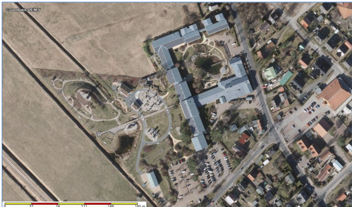
Abb. 1 Luftbild Hotel & Restaurant Seeklause Trassenheide