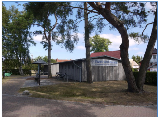
Abb. 6 Planbereich zusätzliche Bebauung (+50 qm)