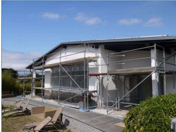
Abb. 3 Planbereich Erweiterung Wellnessbereich