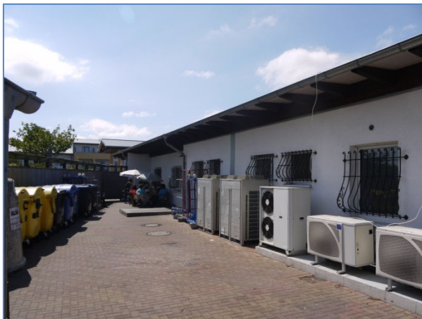
Abb. 5 Planbereich Erweiterung Verwaltungs- und Personalräume