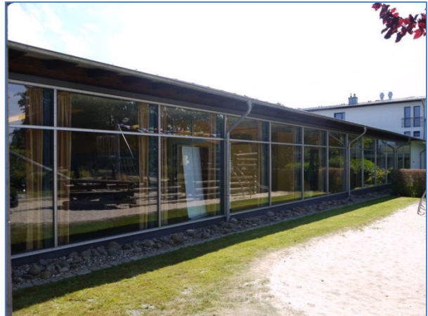
Abb. 4 Planbereich Erweiterung Restaurant