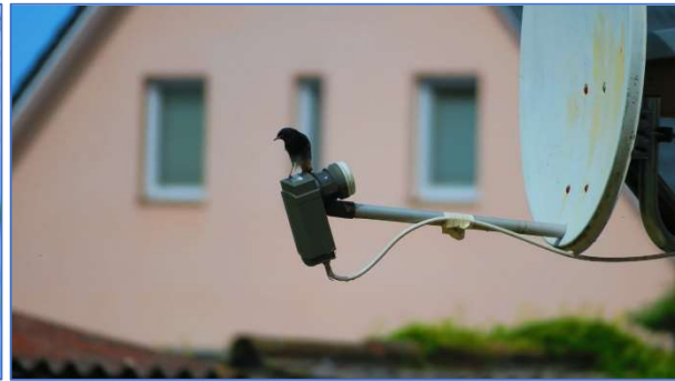
Abb. 13 Hausrotschwanz