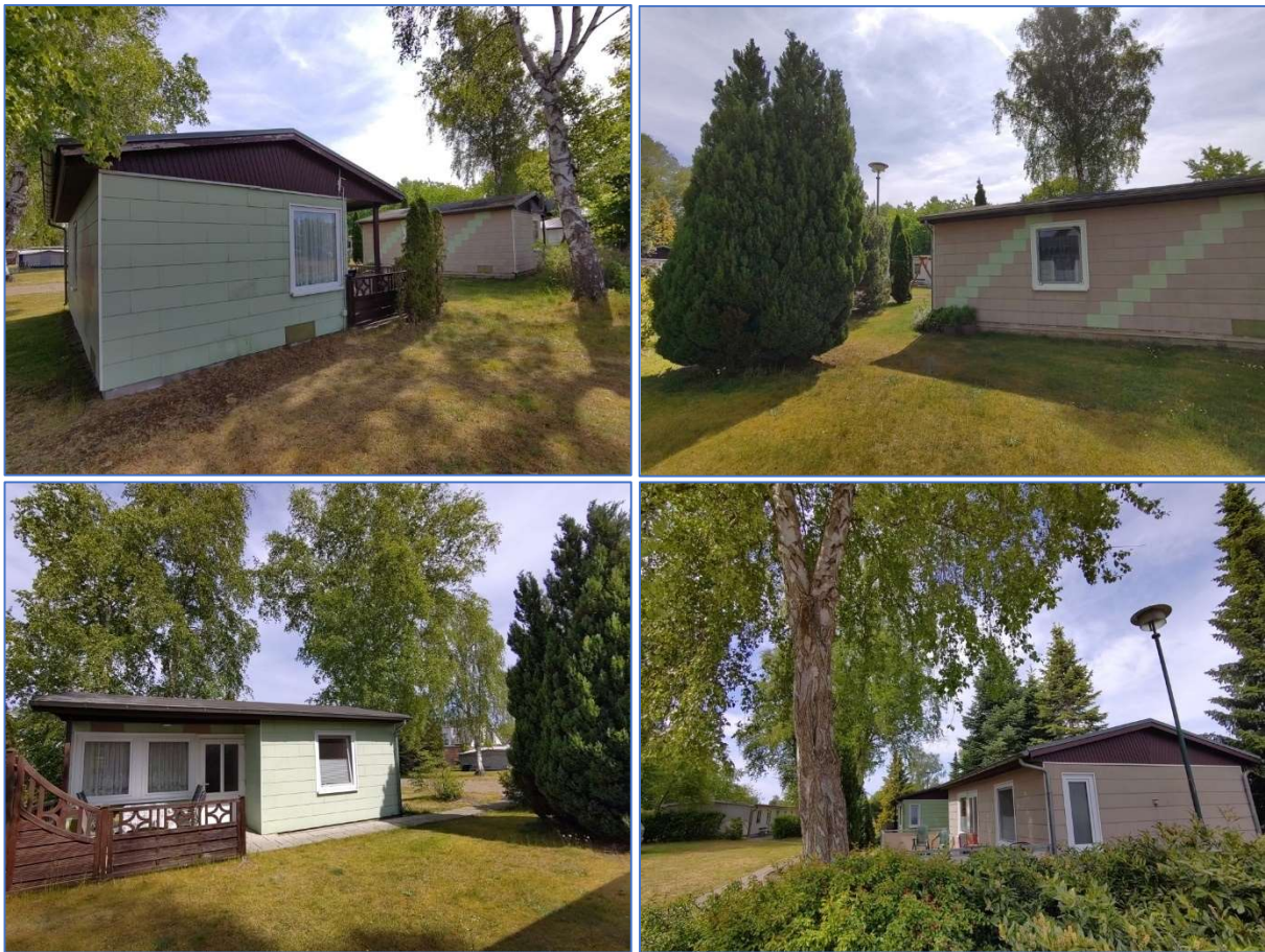
Abb. 8 bis 11 Ansichten der Ferienhäuser in Leichtbauweise