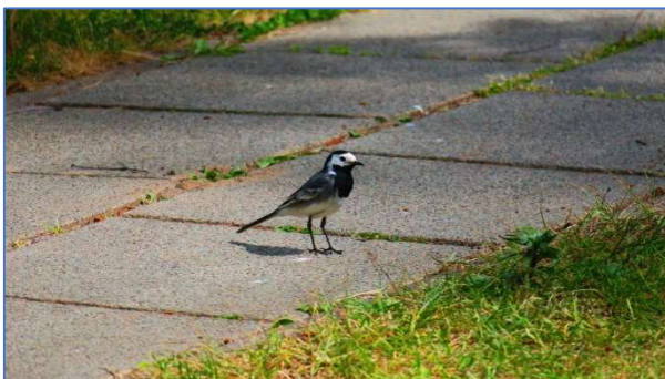
Abb. 14 und 15 Bachstelze adult und Jungvogel