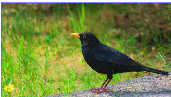
Abb. 16 und 17 Amsel adult und Jungvogel