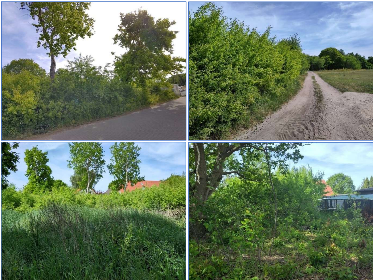
Abb. 4 bis 7 Ansichten des Grundstücks an der Straße „Wilde Hütung“

Im Mai/ Juni 2023 wurden Bestandserfassungen zu Brutvögeln, Fledermäusen und Reptilien im Plangebiet und 50 m-Umkreis durchgeführt. Zudem wurde das mögliche Vorkommen und das Gefährdungspotential geschützter oder gefährdeter Tier- und Pflanzenarten an Hand der Biotopausstattung und der Ortslage beurteilt. Außerdem wurden Bestandsdaten recherchiert, z. B. Umweltkartenportal des Landes Mecklenburg-Vorpommern und Verbreitungsatlas der Amphibien und Reptilien Deutschlands, BfN - Kombinierte Vorkommen- und Verbreitungskarte der Pflanzen- und Tierarten der FFH-Richtlinie - Stand August 2019.