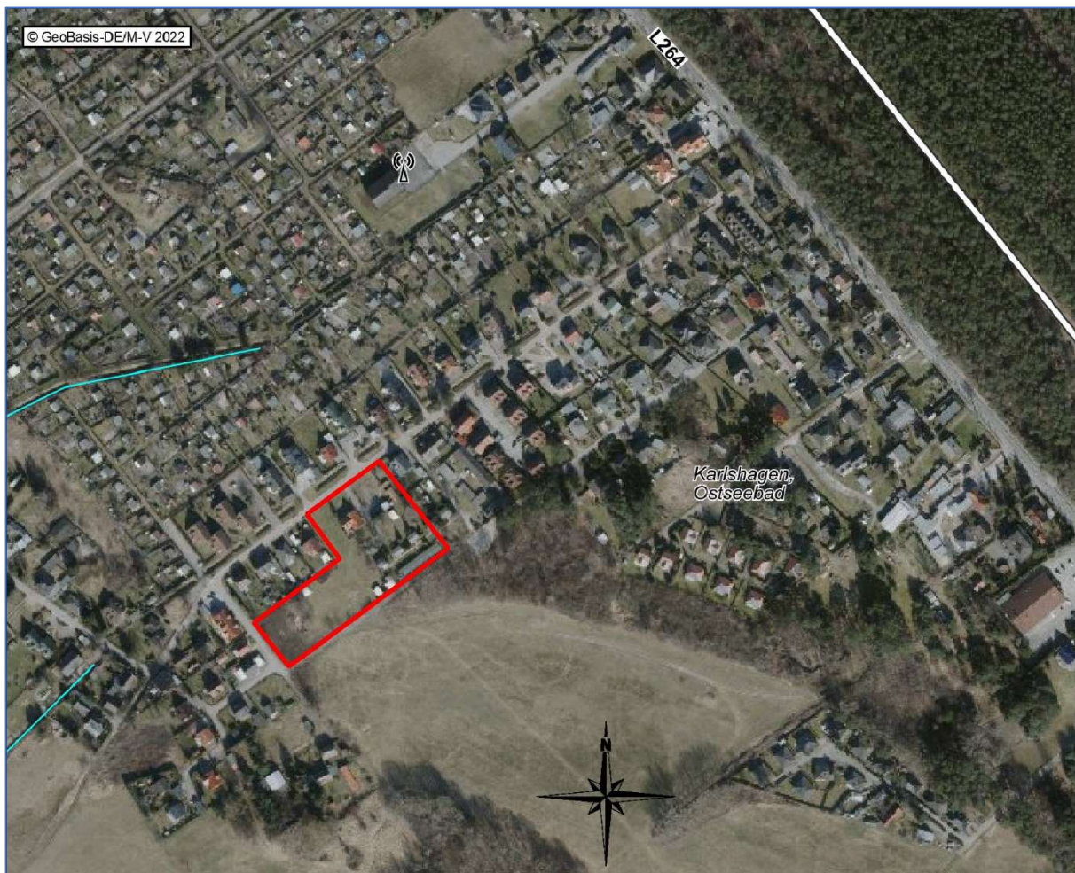
Abb. 2 Luftbild des Plangebietes BP33 Karlshagen

schutzrechtliche Prüfung stellt die Ergebnisse der Erfassungen und Betrachtungen dar und dient den Genehmigungsbehörden als Entscheidungsgrundlage. Ziel ist es, die aus artenschutzrechtlicher Sicht relevanten Konfliktpotenziale zusammenzufassen und diesen mögliche Vermeidungsmaßnahmen bzw. vorgezogene Ausgleichsmaßnahmen (CEF-Maßnahmen) gegenüberzustellen. Auf diese Weise soll die Notwendigkeit der Zulassung von Ausnahmen von den Verbotstatbeständen des § 44 BNatSchG seitens der zuständigen Naturschutzbehörde bzw. der Beantragung einer Befreiung gemäß § 67 BNatSchG ermittelt werden.