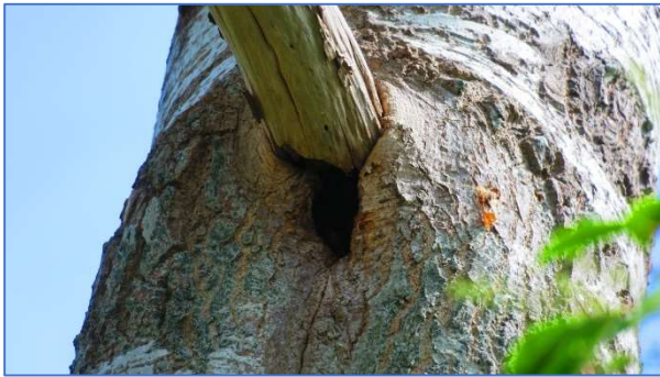
Abb. 12 Baumhöhle in einer Birke

Eine potentielle Gefahr der Tötung oder Verletzung stellen zudem Glasflächen von Neubauten dar. Kollisionen von Vögeln mit Glasflächen von Gebäuden führen immer wieder zu Verlusten, weshalb Minderungsmaßnahmen getroffen werden müssen.