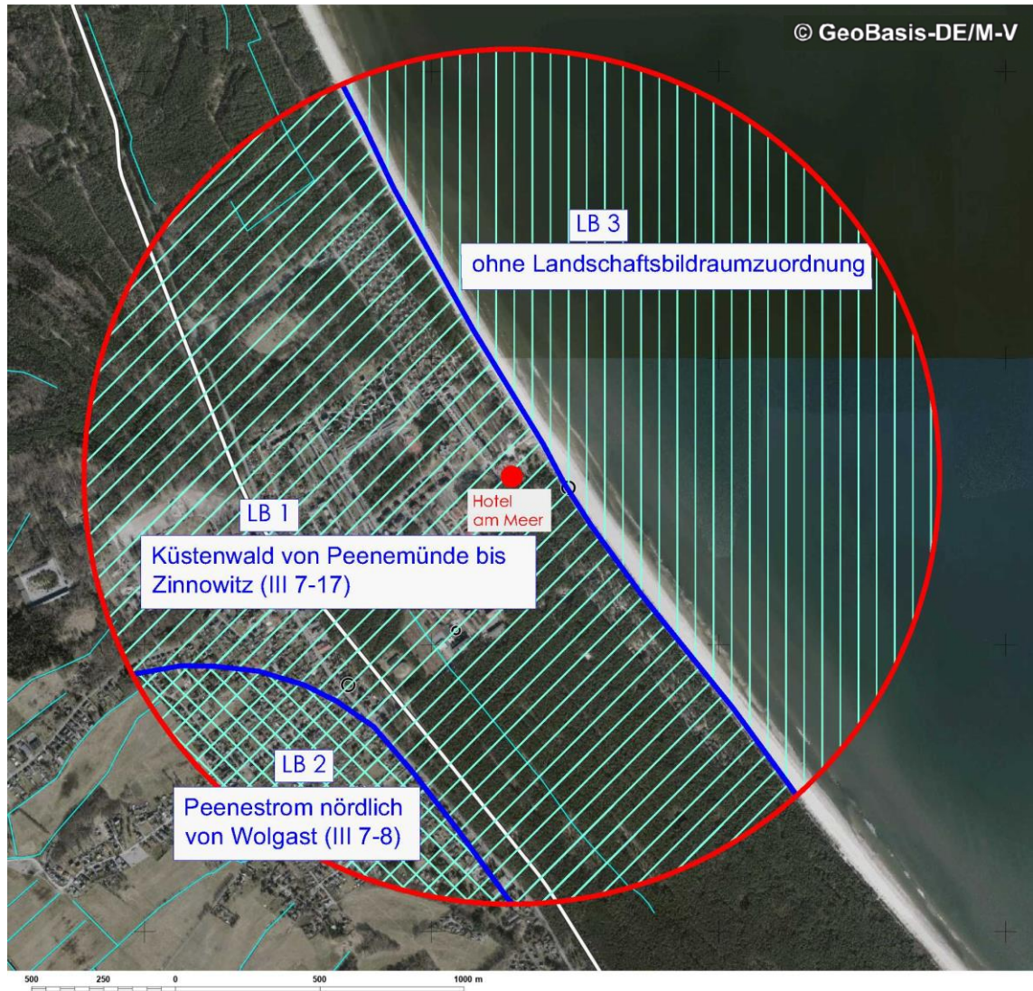
Abb. 2: Verteilung der Landschaftsbildräume gemäß den LINFOS-Daten des LUNG M-V im Untersuchungsraum

Den Hauptteil des Untersuchungsraumes mit 51% nimmt der Landschaftsbildraum „Küstenwald zwischen Peenemünde und Zinnowitz“ (Bild-Nr. III 7-17) ein, der im Ergebnis der Prüfung der Kriterien Vielfalt, Naturnähe, Schönheit und Eigenart gemäß den LINFOS-Daten des LUNG M-V mit einer hohen bis sehr hohen Schutzwürdigkeit eingestuft wird. Der Landschaftsraum wird von einem geschlossenen Küstenwald aus vorwiegend Kiefern und nur teilweise Buchen geprägt, der sich auf den landseitigen Flächen entlang der Ostsee erstreckt. Es handelt sich um ein ruhiges, aber abwechslungsreiches Waldgebiet, welches nur von Siedlungsflächen und im Gemeindegebiet Peenemünde von militärischen Anlagen durchschnitten ist.