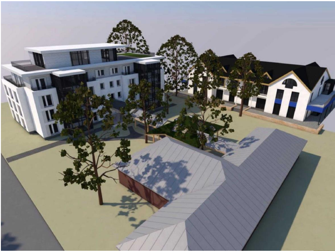
Aufsicht auf das Gebäudeensemble im Geltungsbereich der 5. Änderung des Bebauungsplanes aus südlicher Richtung.