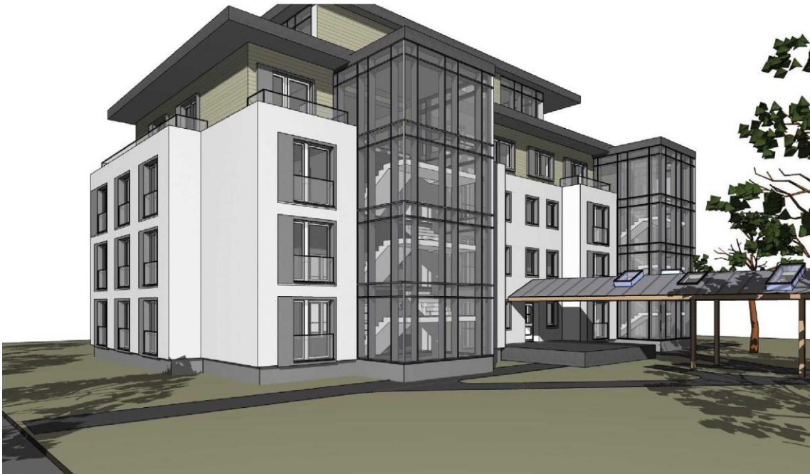
Blick auf das „Hotel am Meer“ aus südwestlicher Richtung. Die Fassade des vorhandenen Baukörpers wird in Weiß gehalten und die Fensterlaibungen grau abgesetzt. Die bis in das 1. Staffelgeschoss reichenden Vorbauten, in denen sich Aufzug und Treppenhaus befinden, sind verglast und damit für den Betrachter transparent. Zu sehen auch der Laubengang, der in den gastronomischen Bereich führt. Hier wurde eine extensive Dachbegrünung mit wechselnden offenen Glasflächen gewählt.