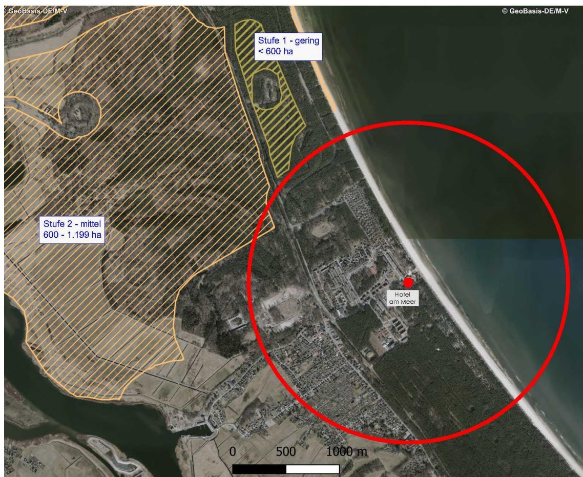
Abb. 3: Kernbereiche landschaftlicher Freiräume im Untersuchungsraum und angrenzend

An den Untersuchungsraum angrenzend befinden sich Kernbereiche landschaftlicher Freiräume mit den Wertstufen 1 und 2. Innerhalb des Wirkungsbereiches des Vorhabens weisen die LINFOS-Daten des LUNG M-V keine Kernbereiche des landschaftlichen Freiraumes mit der höchsten Wertstufe (Wertstufe 4) aus.