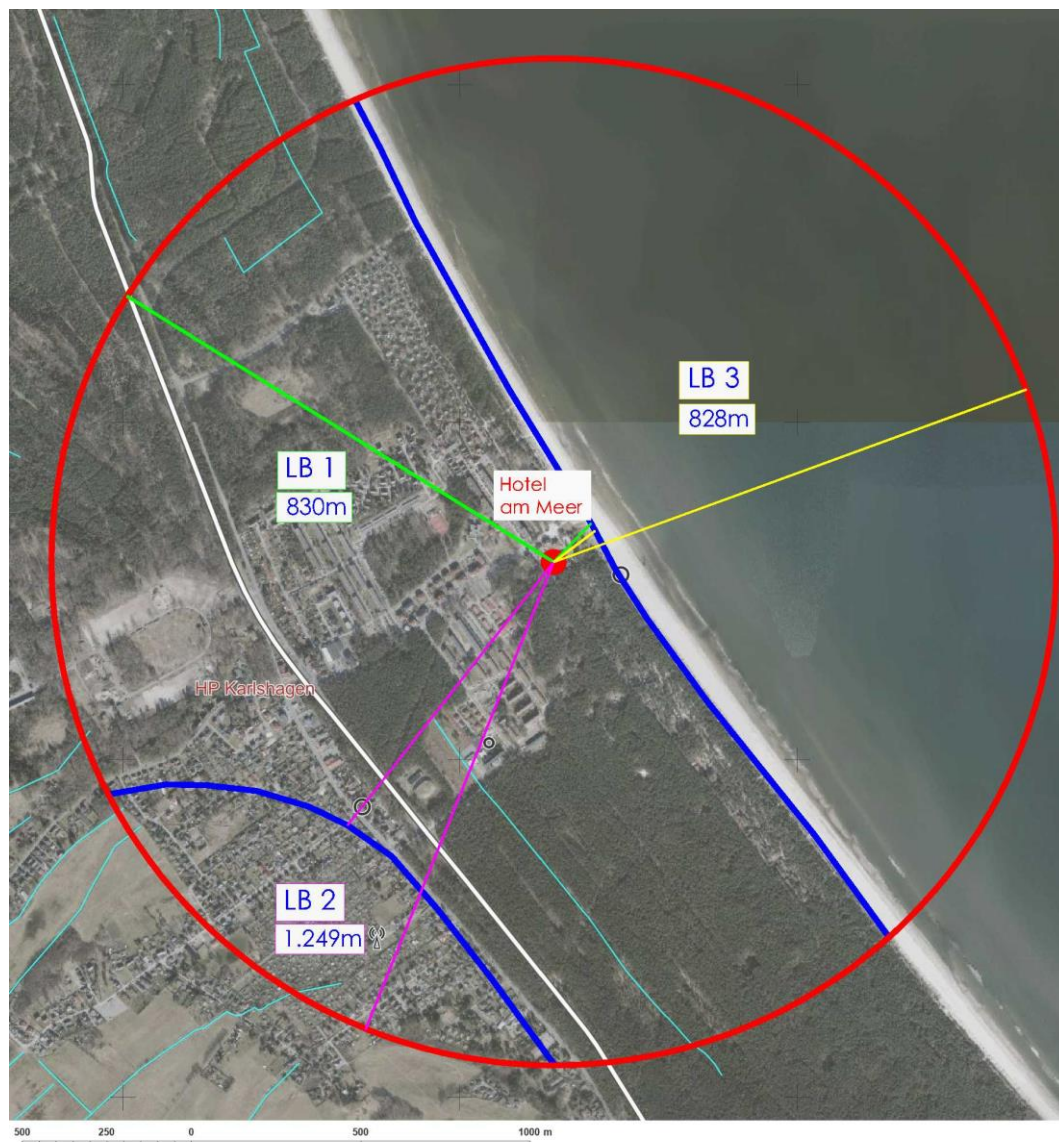
Abb. 4: Darstellung der weitesten und geringsten Entfernung der einzelnen Landschaftsbildräume zum „Hotel am Meer“

Der Abstand des Eingriffsobjektes zum Landschaftsbildraum wird gemittelt und ergibt sich aus der geringsten Entfernung und der weitesten Entfernung des Eingriffsobjektes zu den einzelnen Landschaftsbildräumen innerhalb der Wirkzone. Die mittlere Entfernung (mE) geht nachfolgend in die Berechnung des Beeinträchtigungsgrades (B) ein.