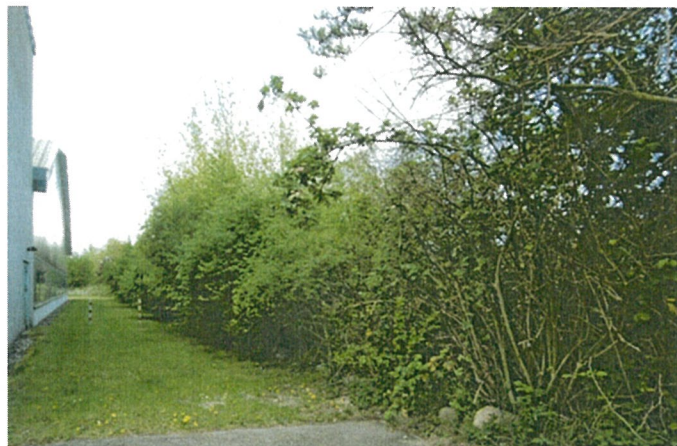
Die nördliche Grenze des Plangebietes bildet eine Strauchhecke.

Gemäß dem Kataster des Landes M-V kommen im Planänderungsgebiet keine gesetzlich geschützten Biotope vor und wurden auch nicht im Bestand vorgefunden.