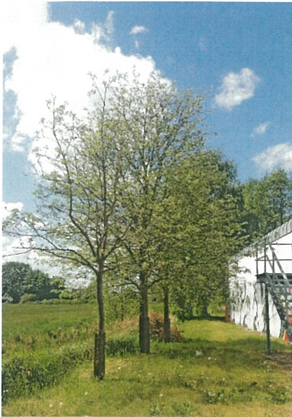
Die Schwedischen Mehlbeeren befinden sich an der südlichen Grenze des Plangebietes.