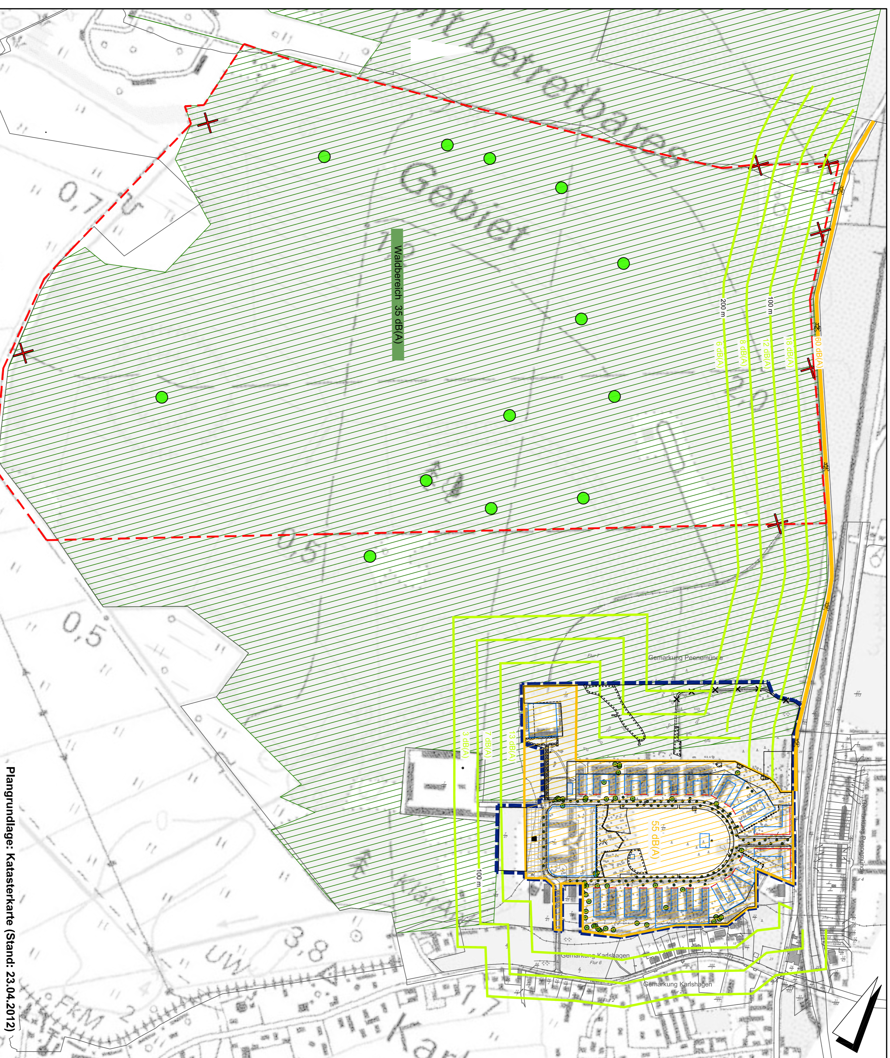
FFH-Verträglichkeitsuntersuchung für das SPA "Walddgebiet Karshagen"