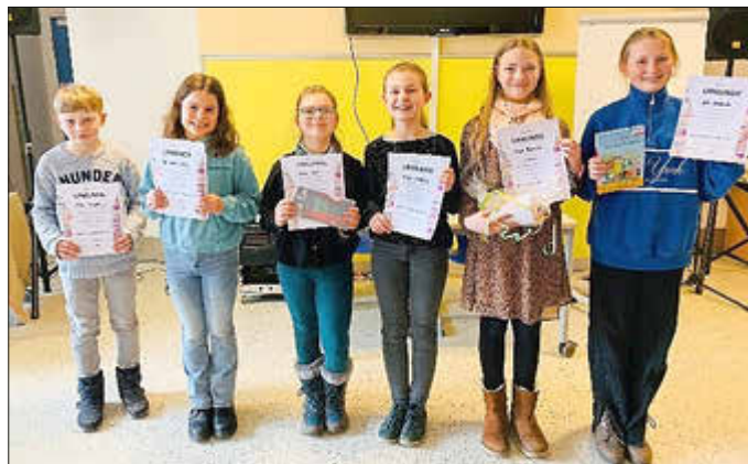
Unsere Teilnehmer und stolzen Gewinner der Klassenstufen 1 bis 4.