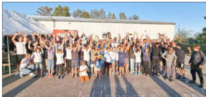
Auf Wiedersehen im nächsten Jahr zum Peenemünder Segellager!