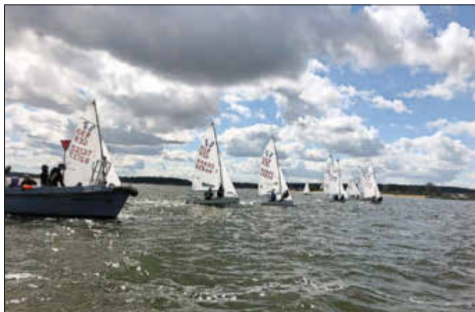
Jollenpokal - Start der 420er in der Spandowerhagener Wiek