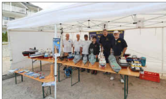
Die Modellbauer mit den Jugendlichen und Helfern