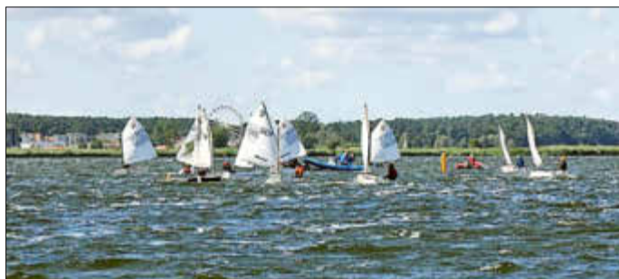
Jollenpokal - Letzte Wettfahrt der Optis bei auffrischem Wind, Luvtonne

Bedanken wollen wir uns im Namen aller Teilnehmer bei allen Trainern, Helfern und Betreuern, die diese anstrengende aber schöne Woche möglich gemacht haben, außerdem bei den Sponsoren der Regatta Crazy4sailing und Selden, sowie allen Förderern unseres Vereins und den Gemeinden Karlshagen und Peenemünde für die Unterstützung unserer Jugendgruppe. Das Segellager wurde gefördert aus Etatmitteln der DSV-Segelerjugend.