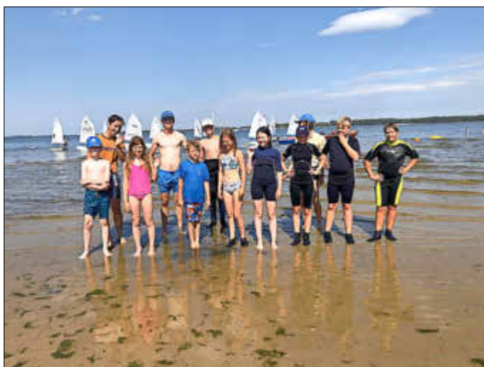
Die Optigruppe am Strand von Freest

In der Woche dominierte bei heißem Wetter leichter bis flauer Wind, davon profitierten unsere Anfänger. Den Regatta-Seglern in Opti, Laser, 420er wurden bei Flaute von ihren Trainern abwechslungsreiche Aufgaben wie Ballspiele mit Boot, Schwammabwurf und Segeln ohne Ruder und Schot gestellt, um keine Langeweile aufkommen zu lassen. Nachmittags mit auflebendem Seewind standen Startübungen und Trainingswettfahrten auf dem Programm.