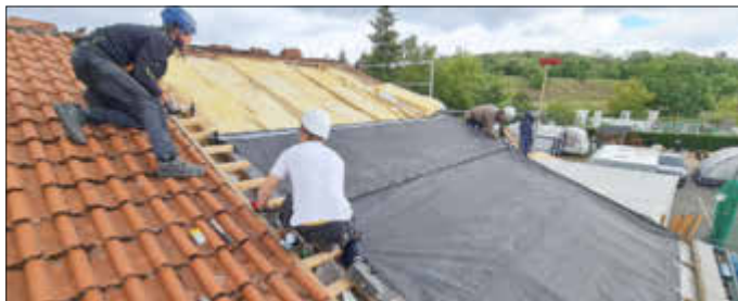
Bauhelfer in Aktion bei der Modernisierung der Dachisolation

Ein buchstäbliches Highlight im Gemeindesaal Zinnowitz ist das verbesserte Lernklima durch die neue Lichtgestaltung. Jehovas Zeugen laden gern jeden ein, ab dem 4. August 2022 die Gottesdienste und den neugestalteten Königreichssaal, wie sie ihr Kirchengebäude nennen, zu besuchen. Mehr Informationen über Jehovas Zeugen und ihre Tätigkeit gibt es auf www.jw.org .