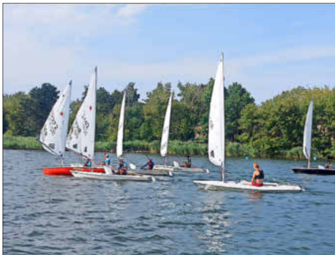
Training der Laser

Kinder und Jugendliche aus dem Inselnorden, Berlin und Rostock trafen sich vom 30.07. - 07.08. mit ihren Trainern und Betreuern bei uns im Verein, um gemeinsam zu segeln und zu campen. Bei einer Rekord-Teilnehmerzahl von 90 Leuten wurde es schon etwas eng auf dem Zeltplatz, aber spätestens nach zwei Tagen hatten sich alle kennengelernt und trafen sich auch in der Freizeit zu Tischtennis, Baden und Angeln.