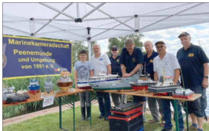
Mannschaft in Ückeritz