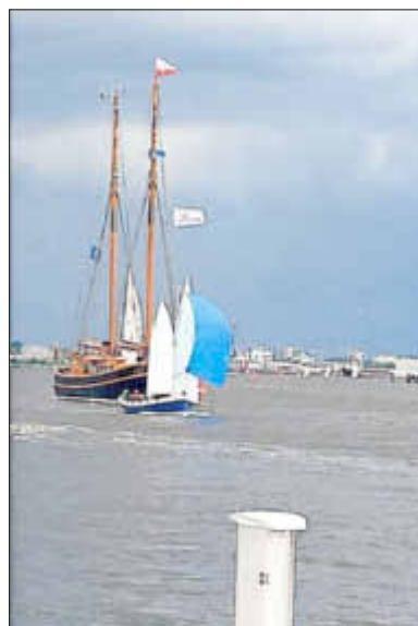
Kutter „Ösfass“ zur Hansesail

Anfang Juli richtete der MRV Peenemünde die „Rudenregatta“ für 25 Teilnehmer aus, dabei belegte das „Ösfass“ den fünften Platz.