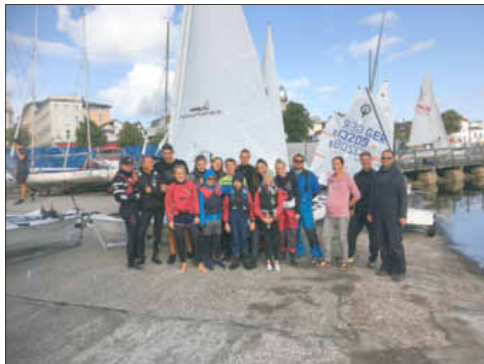
Unsere Trainingsgruppe im Yachthafen Warnemünde

Am Sonntag gab es nur noch eine Trainingseinheit auf dem Wasser und danach wurden die Boote auch schon wieder gepackt, um die Heimreise anzutreten. Alles in allem war es ein sehr gelungenes Trainingslager in einem spannenden Revier mit hervorragenden Bedingungen sowohl auf dem Wasser als auch an Land.