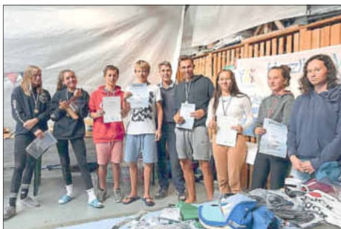
Die Jugend-Zweimannjollen 420er werden geehrt

Damit hat sich unsere Vereinsregatta, die auch als Kreis-Kinder und Jugendmeisterschaft gewertet wird, gut etabliert in der Region. Weitere Höhepunkte der späten Saison für unsere Kinder werden unser Trainingslager in Warnemünde an der Sportschule des Landesseglerverbandes vom 30.8. - 02.09. sowie der „Krösliner Opti-Kurzschlag“ am 06.10., organisiert vom Krösliner Regattaverein, sein.