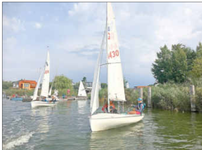
Auslaufen der 420er aus dem Vereinshafen