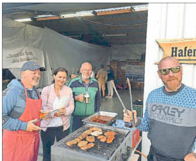
Auf die Hilfe der Eltern bei der Ausrichtung unseres Segellagers konnten wir uns verlassen. Danke!

Bei Bratwurst und Steak und gelegentlichen Regengüssen fand dann eine Siegerehrung statt, hier die jeweiligen Sieger in den verschiedenen Bootsklassen: