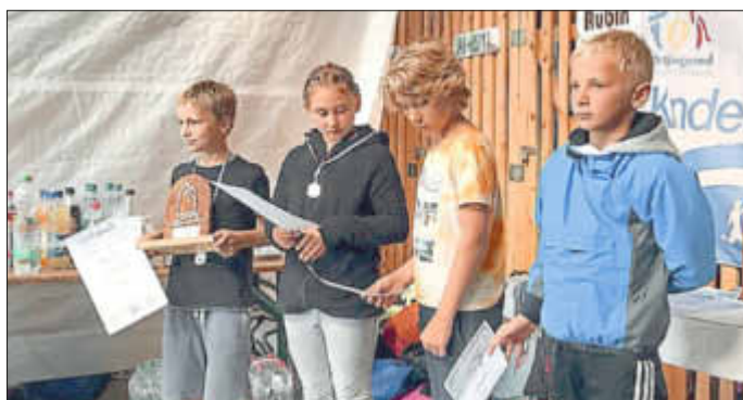
Siegerehrung der Optis