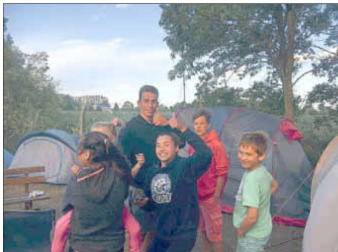
Gemeinsame Freizeit im Zeltlager auf dem Vereinsgelände

Die Abschlußregatta des Segellagers, unsere Peenemünder Jollenpokalregatta, ging dieses Jahr in die fünfte Runde. Wegen des instabilen Wetters (eine Front mit Schauerböen wurde erwartet) musste der Zeitplan geändert werden. So fanden die drei verkürzten Wettfahrten der Optis auf dem Peenestrom vor dem Hafen statt, Laser, Far east und 420er durften sich in der Spandowerhagener Wiek vor Freest „austoben“. Bei auffrischendem Wind waren die drei Wettfahrten auch schnell „im Kasten“ und alle konnten rechtzeitig den Hafen erreichen.