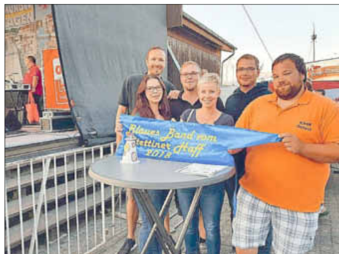
Sieg in Ueckermünde!