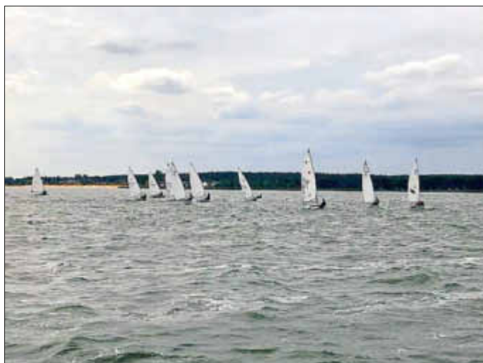
Jollenpokal: Kurs der Laser-Jollen in der Spandowerhagener Wiek vor Freest