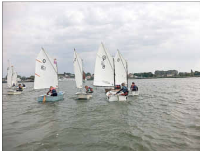
Unsere Opti - Flotte vor Peenemünde

Junge Segler aus Karlshagen, Peenemünde, Kröslin, Zinnowitz, Wolgast und Berliner Gäste trafen sich in der vorletzten Ferienwoche zu unseren bewährten Sommer-Segellagern in Peenemünde und Kröslin. In Peenemünde waren die 8 Jüngsten in der Bootsklasse „Opti“ dabei, unsere 16 Jugendlichen von 14 - 18 Jahren segelten 420er, Laser und FD (Flying Dutchman).