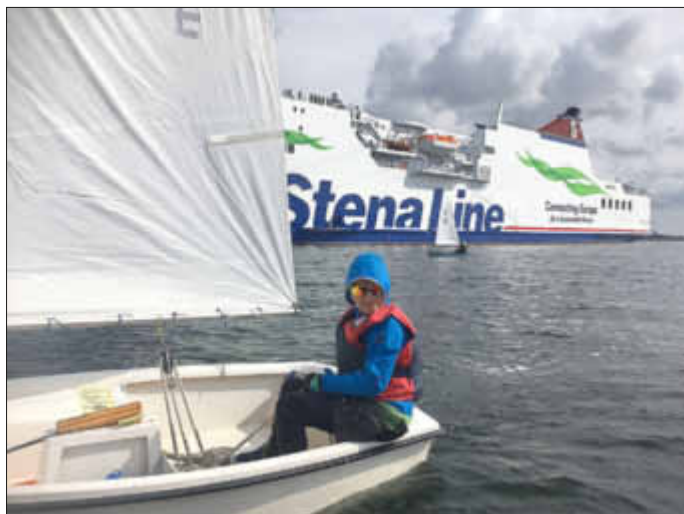
Große Pötte und Peenemünder Optis

Die Bedingungen am Samstag zeigten sich etwas gnädiger mit uns, so dass die Trainingseinheiten auf dem Wasser etwas entspannter und das Segelrevier vergrößert wurde. Nachdem es für einige am Freitag lediglich „durchhalten“ hieß, konnten wir uns am Samstag voll und ganz auf den Feinschliff in Sachen Trimm, Körperhaltung und Effizienz an Bord widmen. Wer vom Segeltraining noch nicht genug hatte, konnte sich noch im Kraftraum der Schule auspowern.