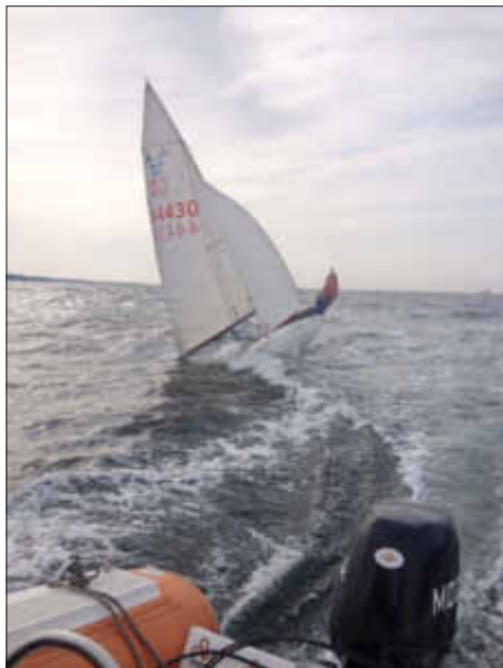
Wellenreiten vor Warnemünde

Nachdem wir am Donnerstagabend angereist waren, starteten wir am Freitag um 09:00 Uhr mit dem Training auf dem Wasser. Die Bedingungen waren hervorragend für eine anspruchsvolle erste Trainingseinheit: Sonnenschein, Windstärke 5 und schöne Wellen. Gegen zwölf Uhr gab es die von einigen schon lang ersehnte, wohlverdiente Mittagspause, bevor es am Nachmittag erneut aufs Wasser ging. Bei unveränderten Bedingungen forderte der Landestrainer auch diesmal wieder vollen Einsatz und höchste Konzentration.