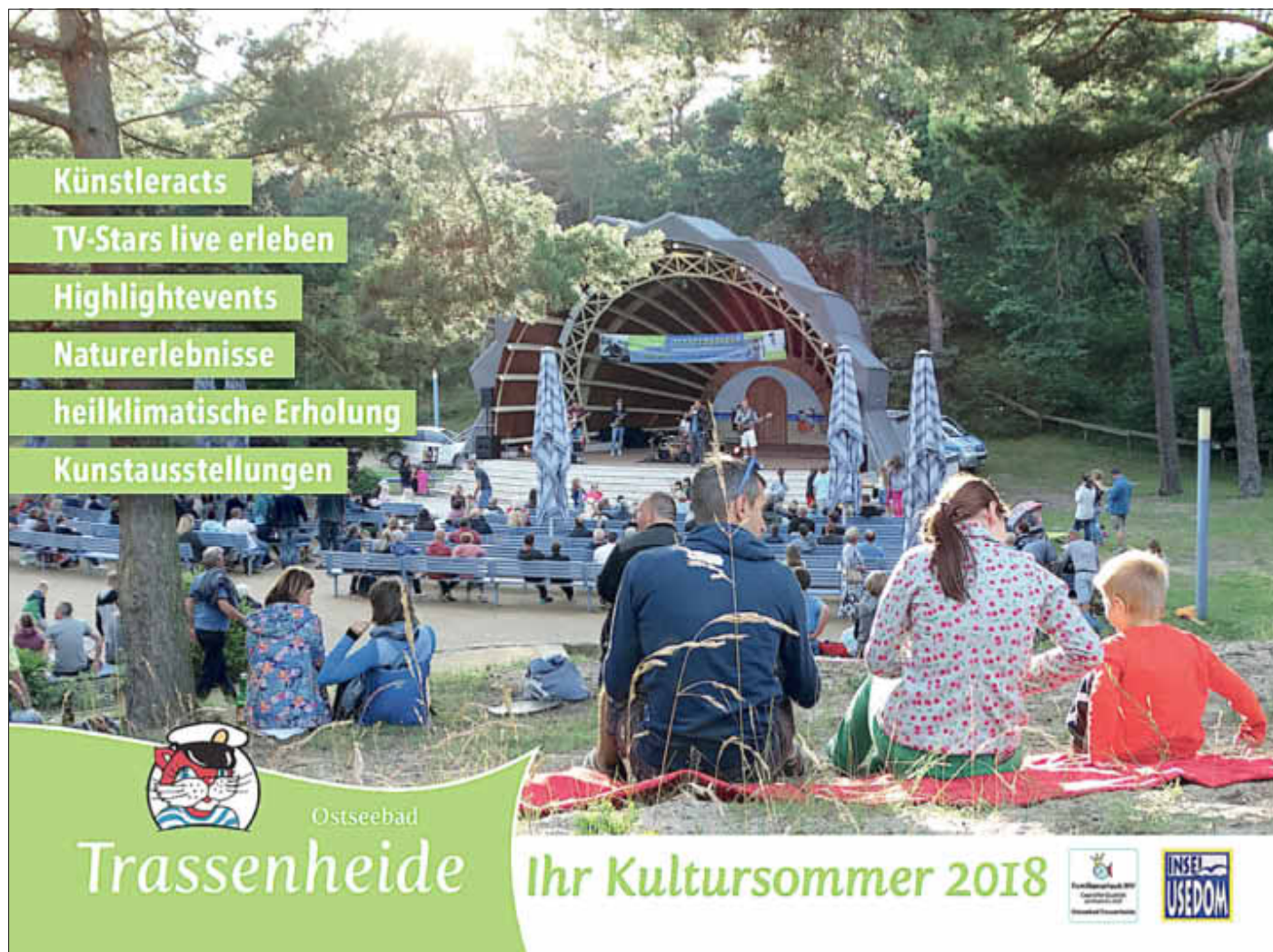
Kultursommer 2018 Titelbild

Druckfrisch ist der Veranstaltungskalender des Ostseebades Trassenheide eingetroffen. Auf 32 Seiten werden familien- und erlebnisorientierte Veranstaltungen und weitere touristische Tipps dargestellt. Erhältlich ab sofort kostenfrei in der Kurverwaltung Trassenheide (Strandstraße 36) oder auch online auf www.trassenheide.de zum Download.