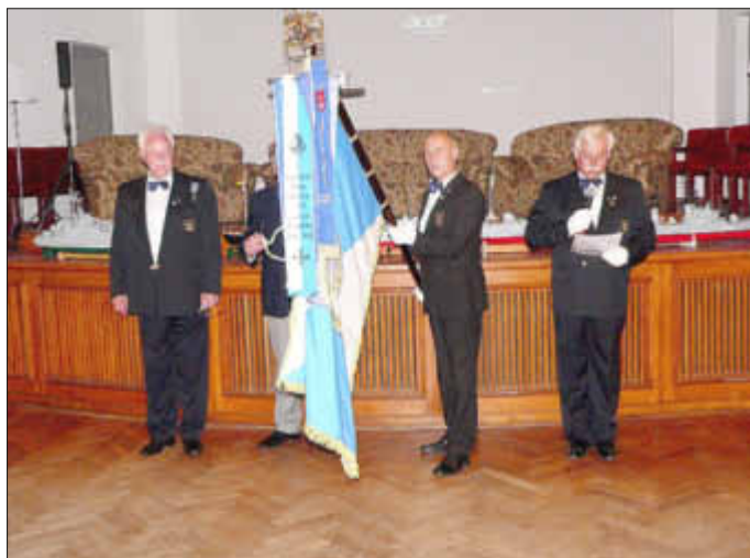
Gedenken an die verstorbenen Kameraden