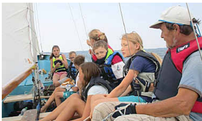
Unterwegs nach Krummin