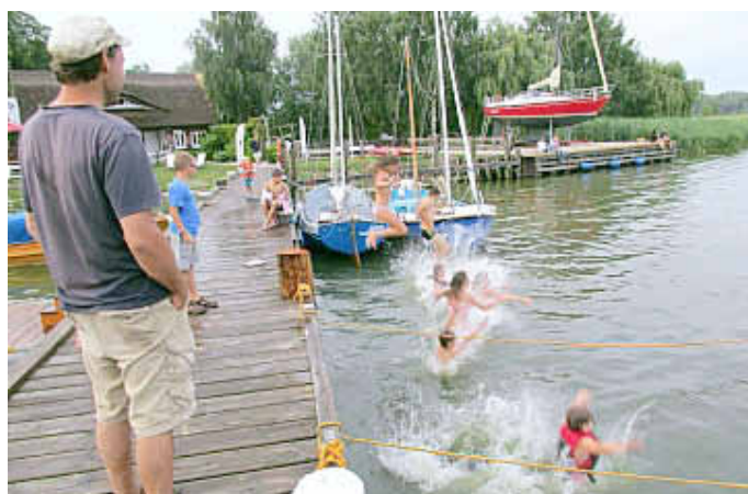
Badespaß am Krumminer Hafen