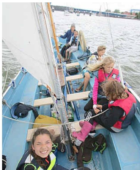
Wolgaster Brücke schließt sich hinter dem „Seehund“