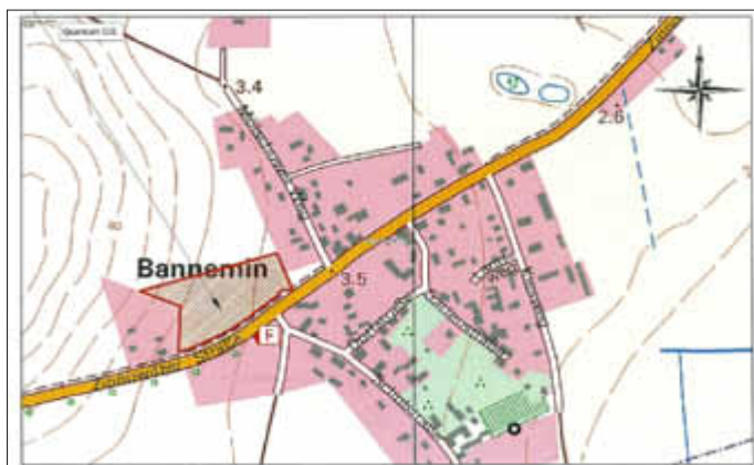
Übersichtsplan M; 1 : 5000

Unsere Querungshilfe ist ebenfalls fertig gestellt, so dass Schulkinder, Gartenbesitzer, Radfahrer und andere Nutzer gefahrenfreier die Kreuzung Hauptstraße/Schulstraße betreten oder befahren können.