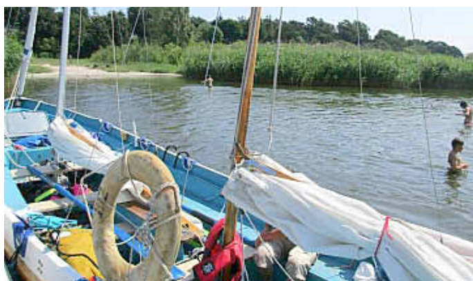
Badepause bei Quilitz