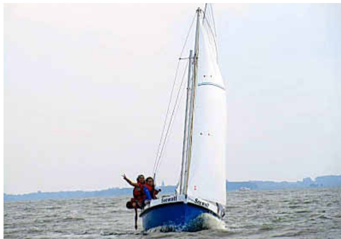
Der „Seewolf“ und seine Besatzung