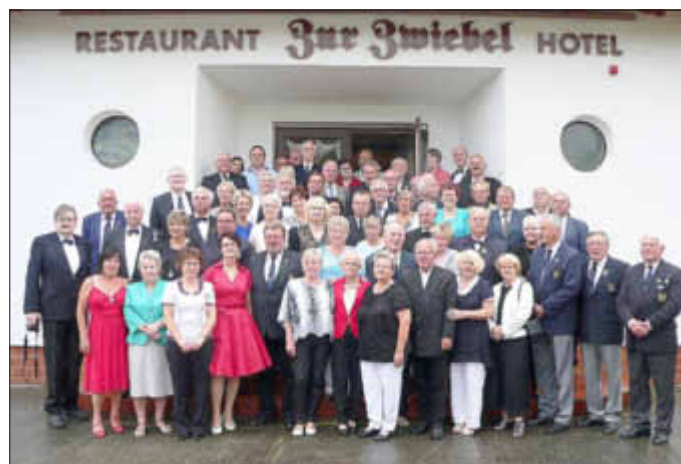
Die MK mit Gästen vor der Peenemünder „Zwiebel“