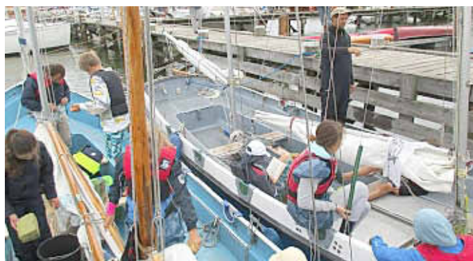
Leinen los in Krummin