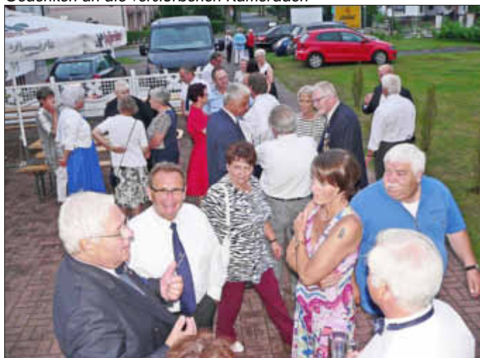
Rees an Backbord mit den Gästen aus Karlskrone und Heide