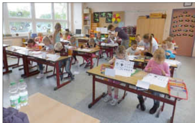
Zukünftige Klasse 1b