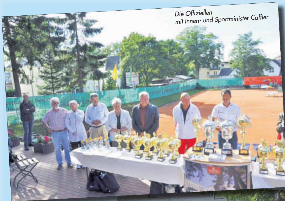
Die Offiziellen mit Innen- und Sportminister Caffier