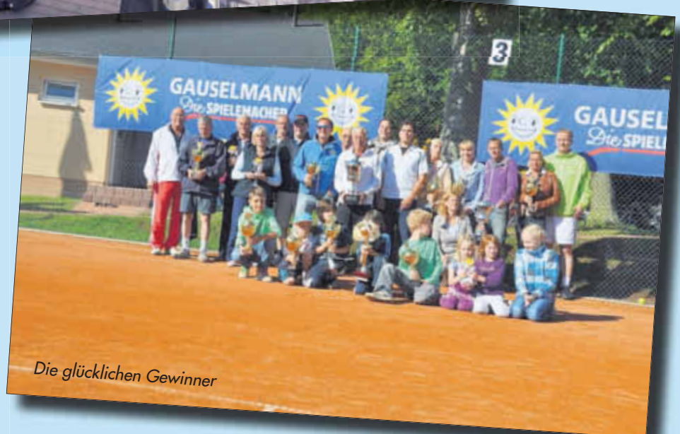
Die glücklichen Gewinner