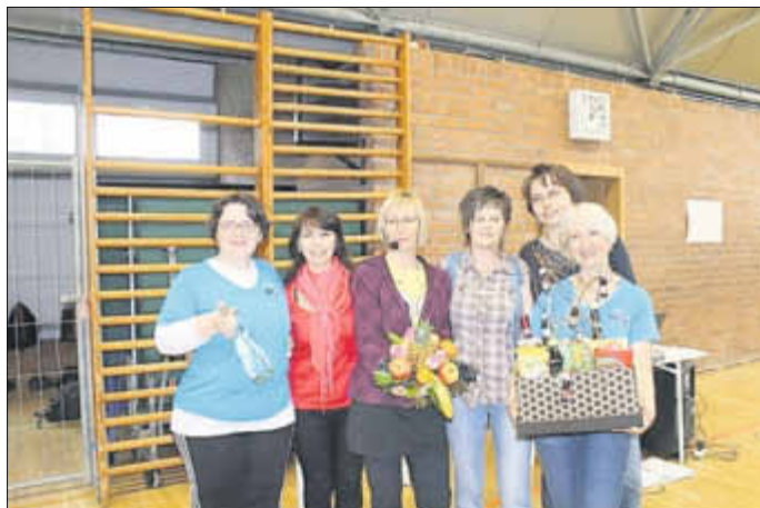
Die Gruppe belohnte sich im Juni für diese Meisterleistung, mit einer gemeinsamen (nassen) abenteuerliche Kajaktour auf der Peene.