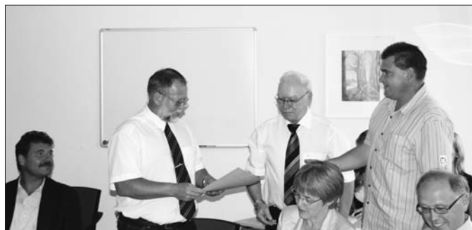
Der neue Amtsvorsteher mit seinen Stellvertretern