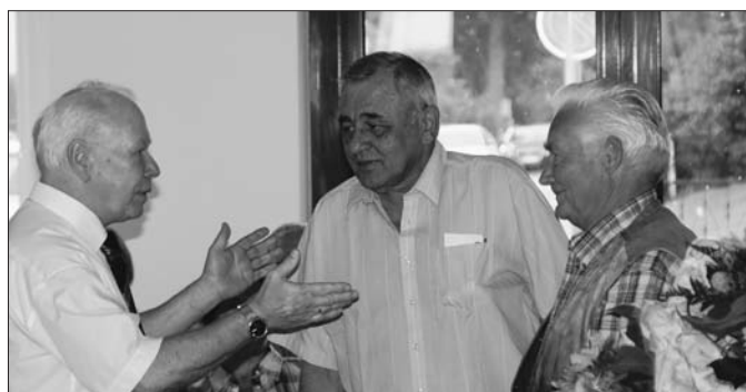
Der Amtsvorsteher verabschiedet die ausgeschiedenen Amtsausschussmitglieder