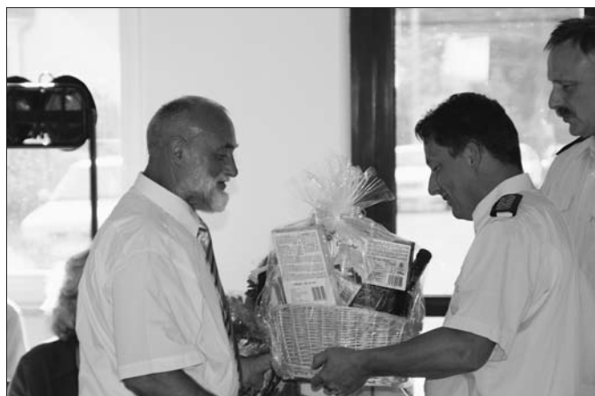
Verabschiedung des alten Amtsvorstehers