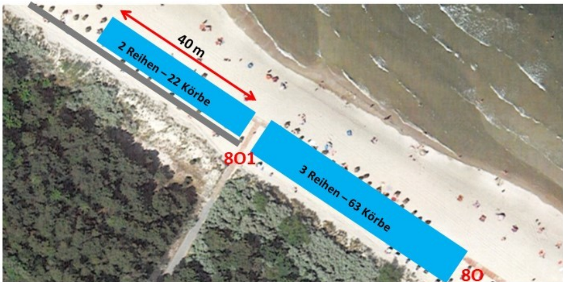
Darstellung nicht maßstabsgerecht!