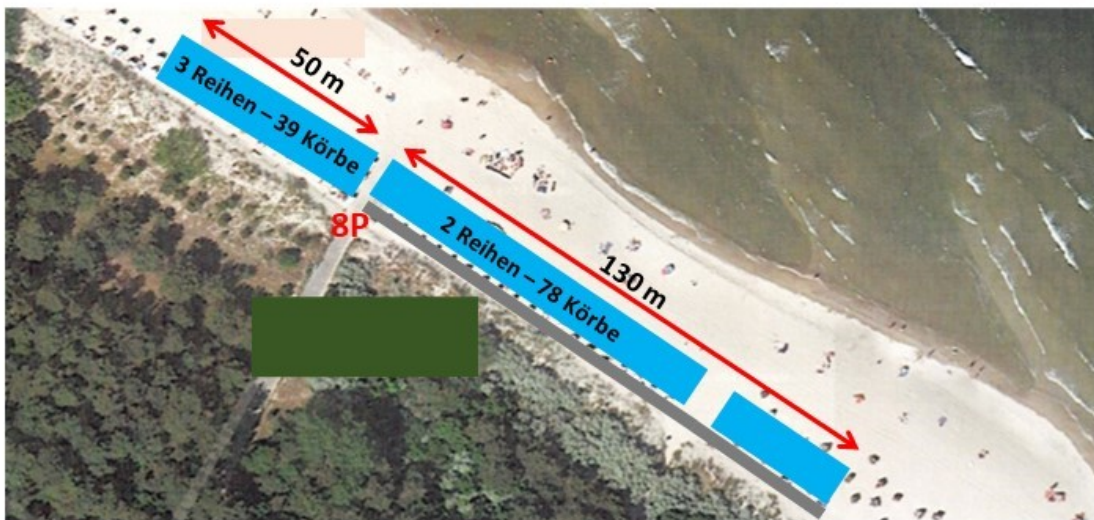
Darstellung nicht maßstabsgerecht!