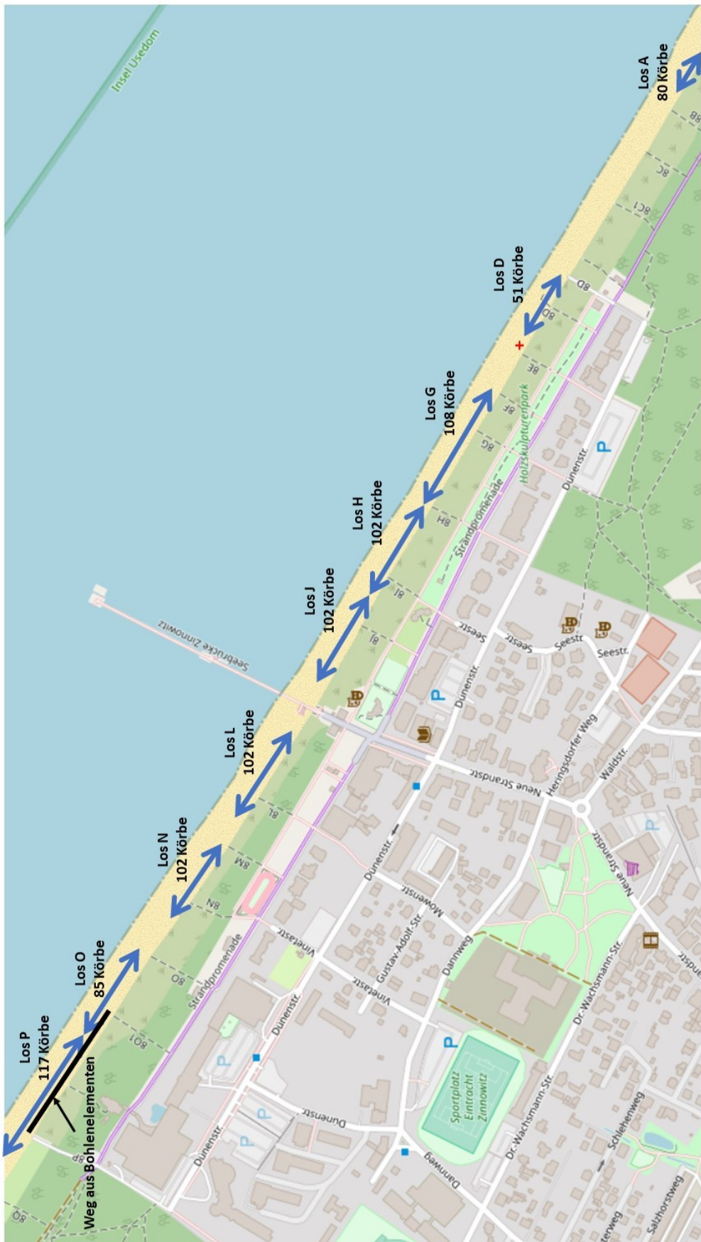
Gewerbliche Strandkorbvermietung ab 2025 - Übersicht